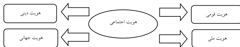
شکل ۲: وضعیت ابعاد متغیر مستقل هویت اجتماعی دانشجویان

تقابل با دیگران در قالب مقولاتی و شاخصه هایی نظیر ؛ قومیت، دین، ملیت و جهانی وطنی است.» (تعریف عملیاتی). در شکل (۲) باز شناسی ابعاد مفهوم هویت اجتماعی دانشجویان در قالب قومیت، دین، ملیت و جهان وطنی آمده است.